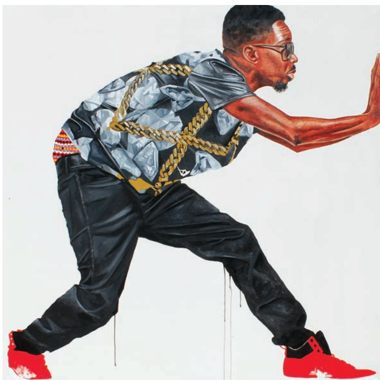
Fahamu Pecou, Caged Bird , acrylique sur toile, 183 x 183 cm