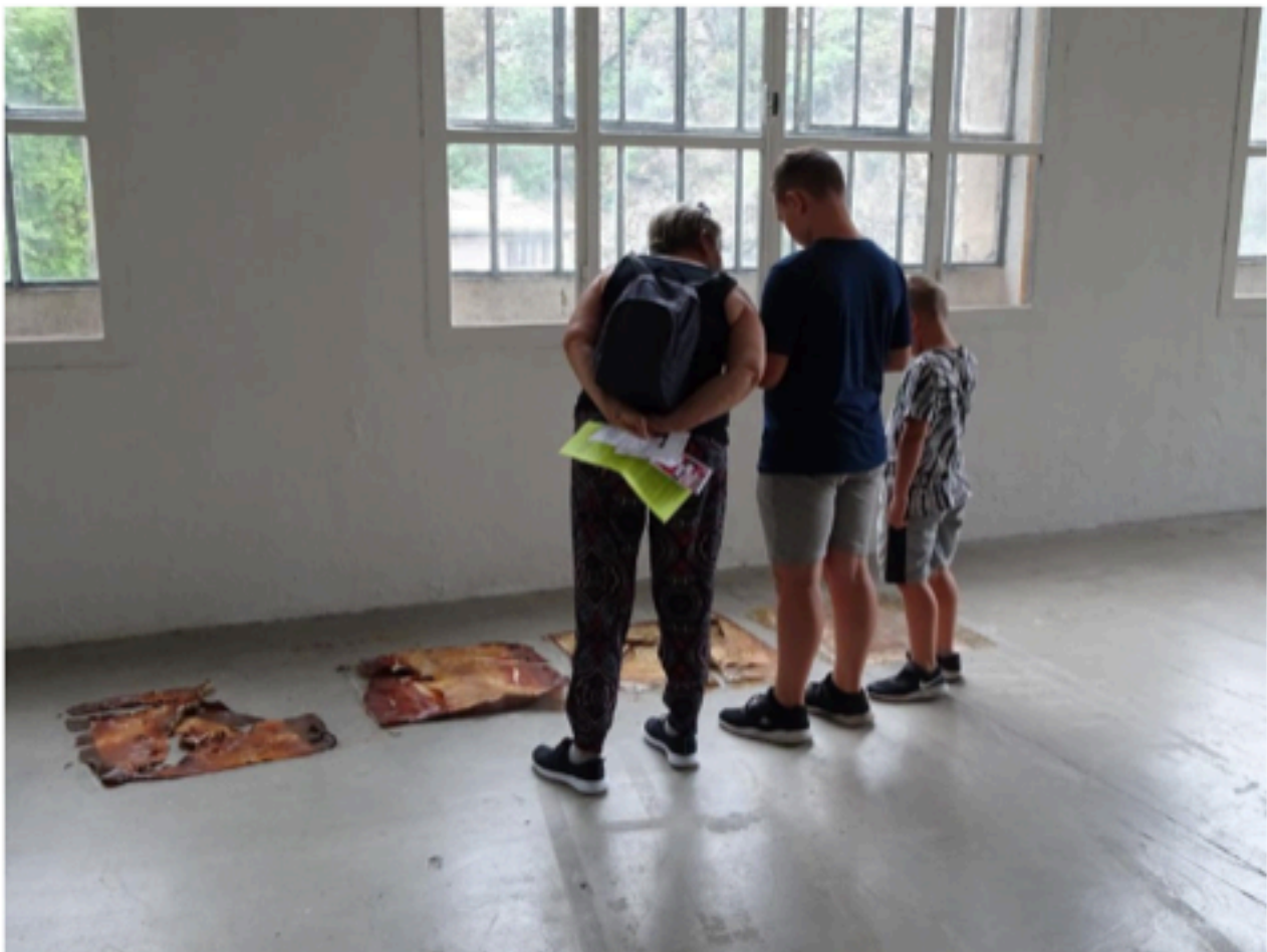
Deux expositions qui raviront petits et grands au Creux de l'Enfer au centre d'art contemporain d'Auvergne à Thiers.