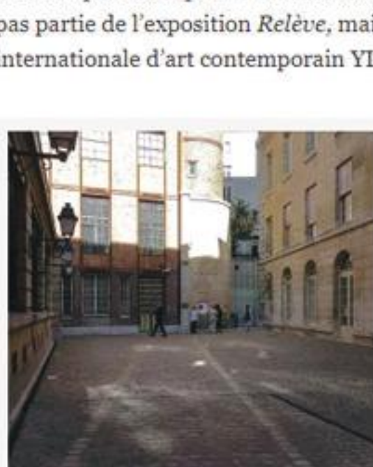
Le Crédit Municipal Paris, cour Théophraste Renaudot avec au sol le tracé de l'enceinte Philippe Auguste, au fond la tour et à droite la Galerie

À noter que la sculpture Volée Hélicoïdale , de Cyril Zarcone, exposée dans la cour, ne fait pas partie de l'exposition Relève , mais de la programmation Hors-Les-Murs de la foire internationale d'art contemporain YIA ( Young international Artists ) Art Fair.