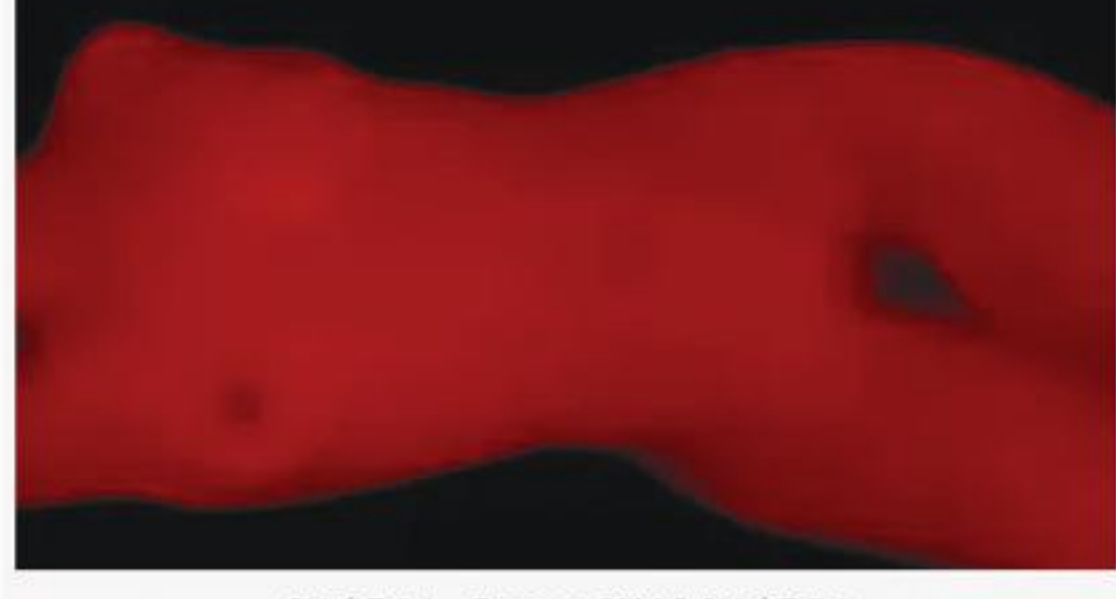
Chloé Tallot, « Ragazze », 2004