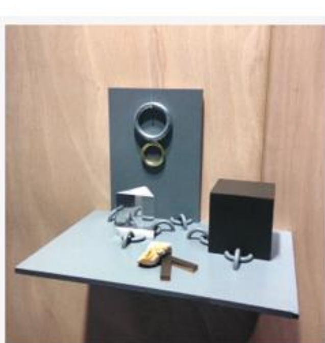
Irène Karabayinga, « Untitled (Set up#4) »

Un exemple parmi d'autres qui caractérise un accrochage où « les pièces dialoguent », comme tient à le souligner Laure Wauters. Une nécessité, ce « dialogue » pour qu'au-delà de formats, médiums, propos très divers, les oeuvres soient mises en valeur et s'offrent au visiteur comme un champ des possibles, dans une confrontation signifiante mais paisible qui laisse aussi à celui qui les regarde sa liberté d'interprétation. Et c'est réussi.