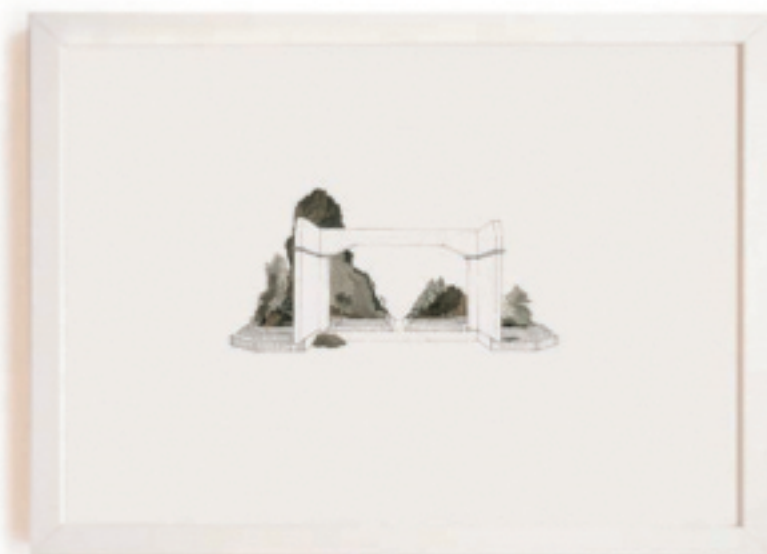
Claude Toffignos, série "Tétrale Floor", sténographie, dessin, collage, 30 X 40 cm.