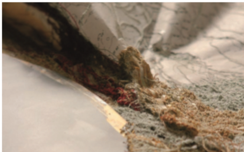
Cathryn Beech, Sans titre, 2014 (détail). Photographie aérienne, plan cadastre, carte topographique sur papier calque, bédouine, couture machine. Collection privée.

Drawing Now est un rendez-vous désormais incontournable dans l'agenda bien rempli de la semaine du dessin, en synergie avec des institutions partenaires, pour un parcours dans tout Paris offrant le meilleur à un public assidu et connaisseur. Pour cette 9 e édition, une nouvelle mise en scène donnera à voir sur les deux niveaux du Carreau (soit 3000m 2 ) toutes les facettes du dessin contemporain, le second étant dédié au secteur Emergence pour les galeries qui ont fait ce choix. Renforçant sa dimension internationale, le comité de sélection présidé par Philippe Piguet accueille pour la première fois Bsy Lahnet, curateur art contemporain au musée Albertina de Vienne, et Andreas Schallhorn, conservateur art moderne et contemporain au Kupferstichkabinett - musée arts graphiques des Staatliche Museen de Berlin. Le Prix Drawing Now dé-