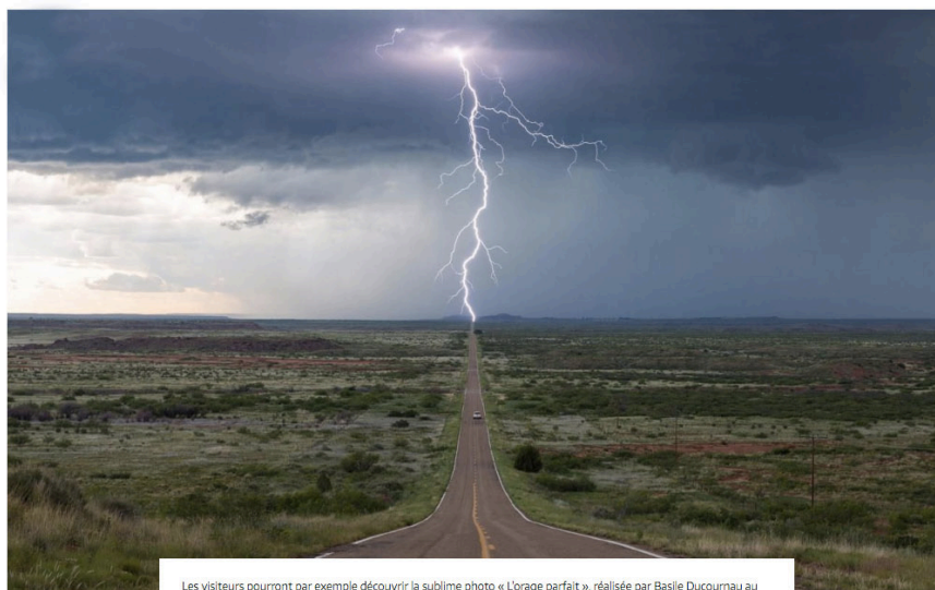
Les visiteurs pourront par exemple découvrir la sublime photo « L'orage parfait », réalisée par Basile Ducournau au Nouveau-Mexique en 2015. DR

Plus de 4 000 visiteurs sont attendus à cette exposition qui, hasard du calendrier, fait cette année la part belle au dérèglement climatique.